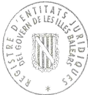
Miquel Solivellas Aguiló